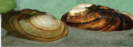
Muscheln unterliegen dem Artenschutz.

Das Seeufer hat eine wichtige Funktion als Laichplatz und dient den Fischen als Brutstätte. Die sogenannten Krautlaicher, wie Brachse und Karpfen, sind auf Pflanzenbewuchs angewiesen, die Kieslaicher, wie Barbe und Forelle, benötigen ein Kiesbett zum Laichen. Schaffen Sie dafür auf Ihrem Grundstück vielfältige Strukturen!