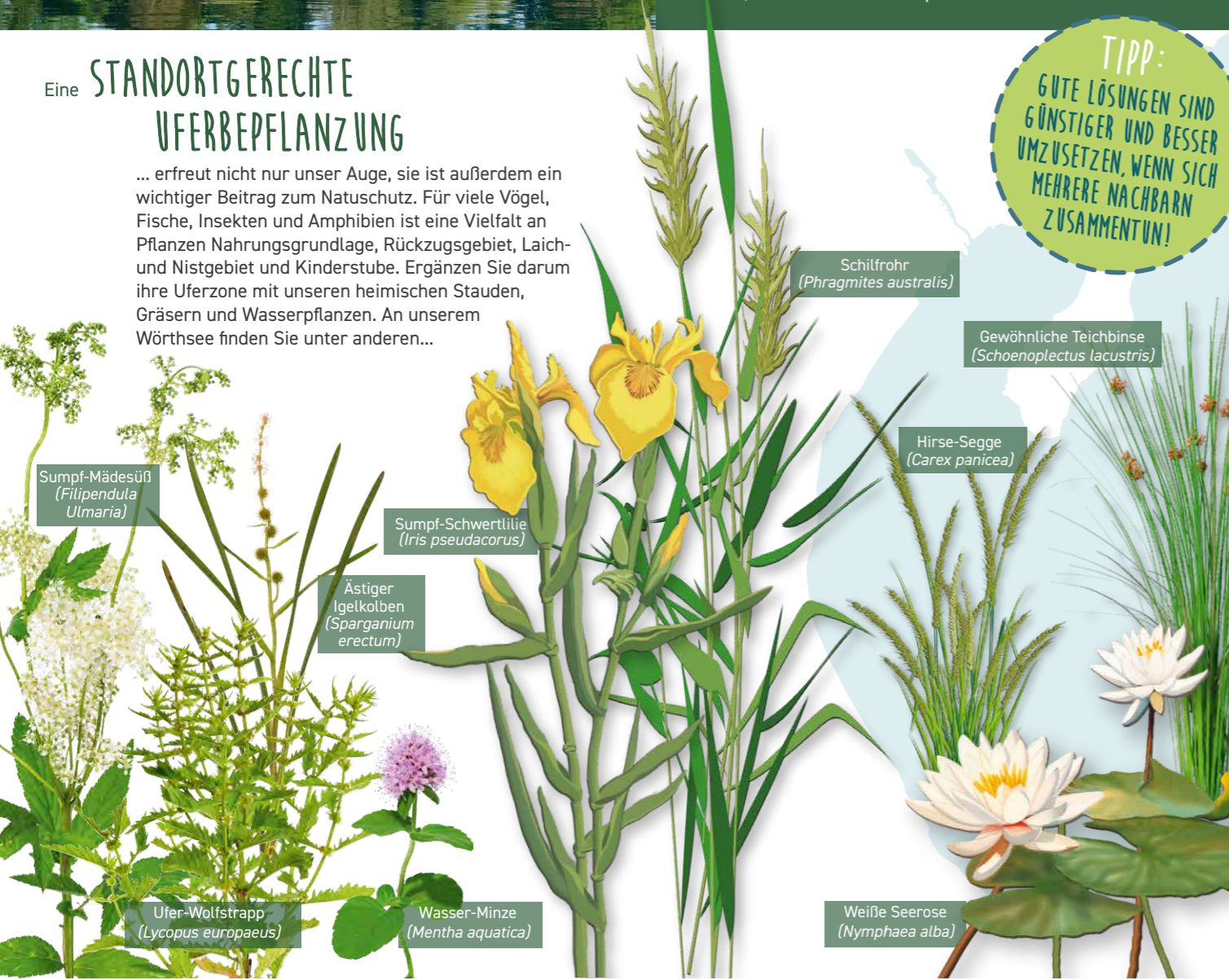
Sumpf-Mädesüß ( Filipendula ulmaria )