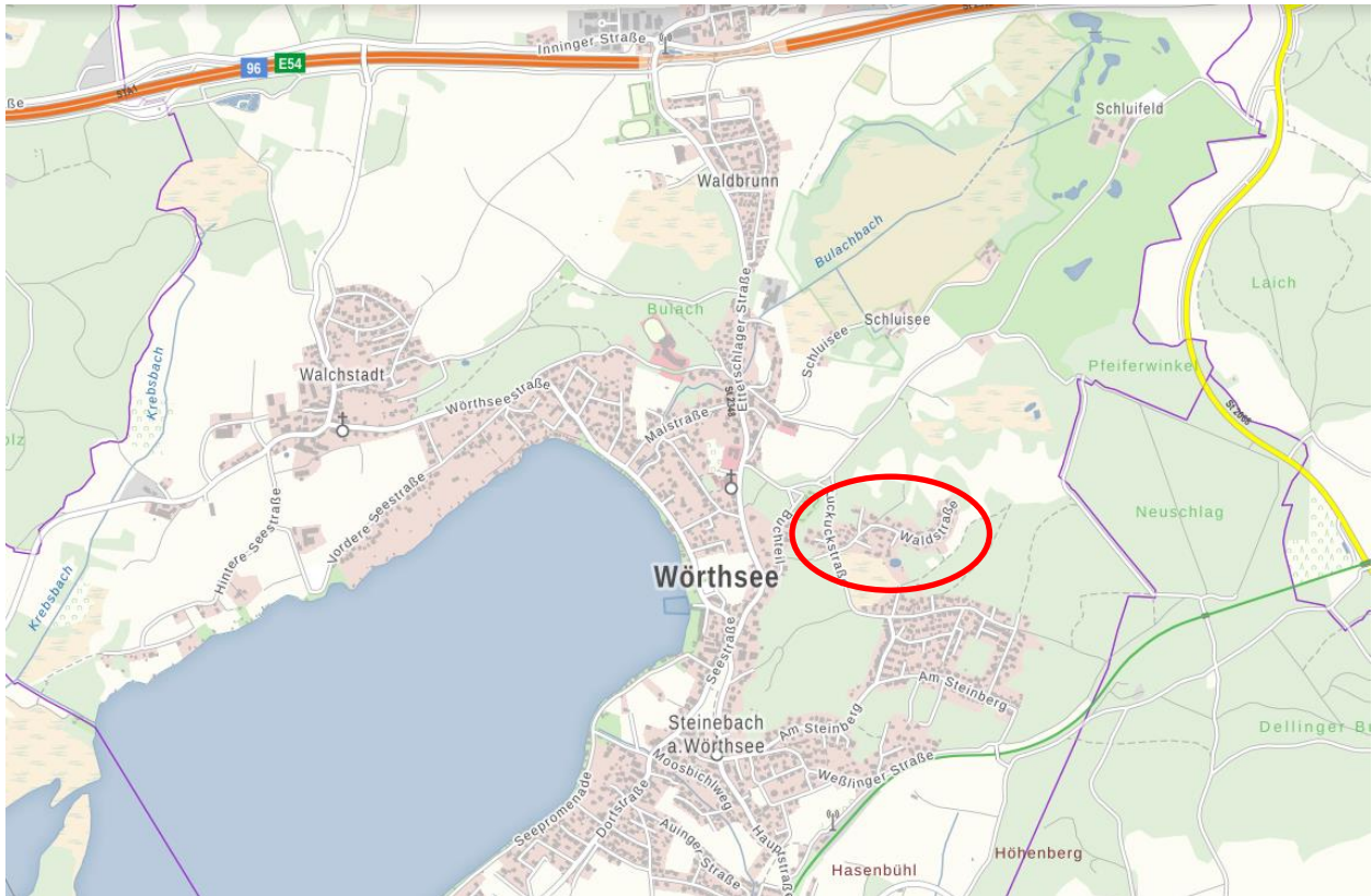
Abb 1: Lage des Plangebiets.

und Moorflächen vom Wohngebiet der Waldstraße getrennt, der Bebauungsplan Nr. 26 Kuckucksstraße Nordseite an den Geltungsbereich des Bebauungsplans Nr. 10 an, welcher aus lockerer Wohnbebauung besteht.