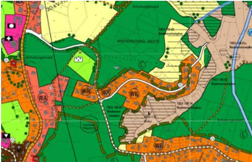
(Abb.5): Ausschnitt aus dem rechtswirksamen Flächennutzungsplan der Gemeinde Wörthsee mit dem Plangebiet.

Für das Gebiet gilt der rechtswirksame Flächennutzungsplan (FNP) der Gemeinde Wörthsee. Dieser stellt den Geltungsbereich als reines Wohngebiet (WR), Wald sowie Sukzessionsfläche, Feuchtgebiet dar (Abb. 5).